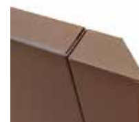
Angle double joint 45°