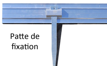
Patte de fixation